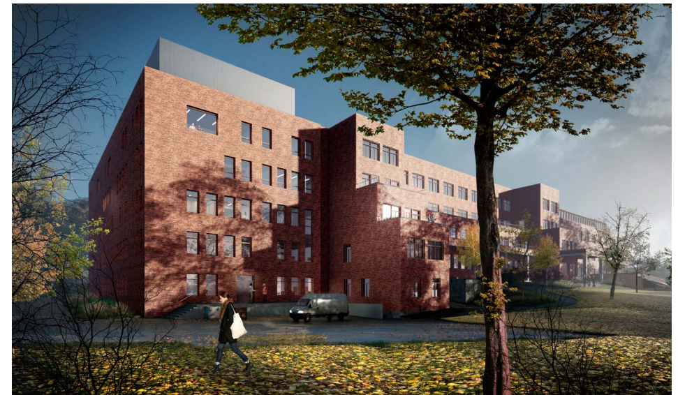
ILLUSTRASJON AV NYBYGGET: RATIO Arkitekter AS

Orientering om byggeperioden 2018 - 2020